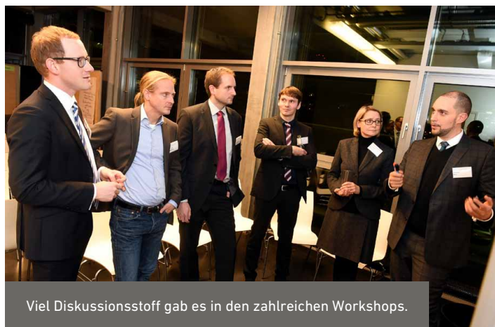
Viel Diskussionsstoff gab es in den zahlreichen Workshops.

auch Deutschland hat die Agenda 2030 und den Pariser Klimavertrag unterschrieben und ordnet damit die eigene Politik in diesen ehrgeizigen internationalen Referenzrahmen ein. Wenn ich in der Welt unterwegs bin, dann höre ich oft viel Respekt für die deutsche Nachhaltigkeitspolitik. Das Flaggschiff Energiewende wird im Ausland oft mit Bewunderung verfolgt (wenn es auch nicht selten eine skeptische Bewunderung ist). Und es blieb auch nicht unbemerkt, dass Deutschland im Juli beim High Level Political Forum, das