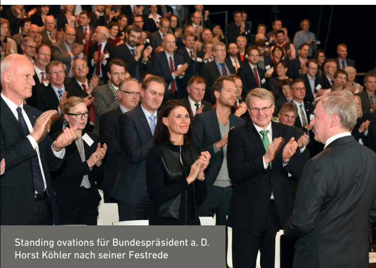
Standing ovations für Bundespräsident a. D. Horst Köhler nach seiner Festrede

Vielleicht fällt es uns so schwer, die Zukunft zu gestalten, weil wir unsere Gegenwart so schlecht verstehen. Und wir leben ja in einer seltsamen Zeit. Ausgerechnet jetzt, wo deutlich wird, dass unsere Probleme erstens komplex und zweitens global sind, scheinen jene Kräfte Oberhand zu gewinnen, deren Antworten erstens simpel und zweitens national sind. Aus der Tatsache, dass die großen Krisen unserer Zeit – Pandemien wie Ebola, Finanzkrisen, Klimawandel, die Flüchtlingskrise – mit den Mitteln des Nationalstaates allein nicht mehr zu bearbeiten sind, müsste ja eigentlich der Schluss gezogen werden, dass wir mehr internationale Zusammenarbeit brauchen, dass wir globale Lösungen brauchen. Stattdessen droht in vielen westlichen Demokratien die Diskreditierung globaler Kooperation plötzlich mehrheitsfähig zu werden. Das ist nicht nur paradox, sondern offenbart auch ein gehöriges Stück Heuchelei. Denn es war ja gerade der Westen, der nach dem Zweiten Weltkrieg das bestehende