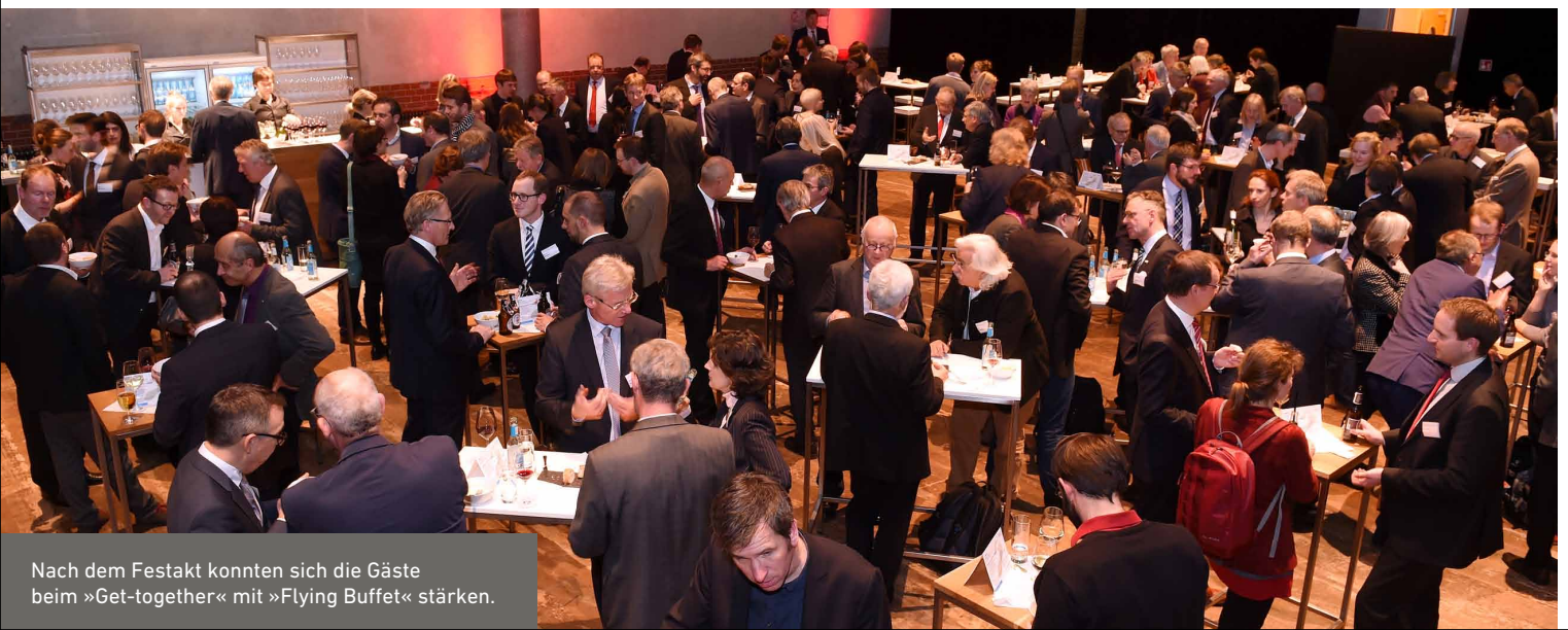
Nach dem Festakt konnten sich die Gäste beim »Get-together« mit »Flying Buffet« stärken.

Dieses Dilemma lässt sich nicht einfach auflösen. Wir können nicht die demokratische Mehrheit der Gegenwart im Namen der Zukunft übertrumpfen – das wäre dann die Ökodiktatur. Aber wir brauchen ein neues Bewusstsein für die langfristigen Folgen von Politik, die im Anthropozän eben teilweise irreversibel sind. Hans Jonas hat das schon 1979 mit seinem »Prinzip Verantwortung« auf den Punkt gebracht: »Handle so, dass die Wirkungen deiner Handlung verträglich sind mit der Permanenz echten menschlichen Lebens auf Erden«.