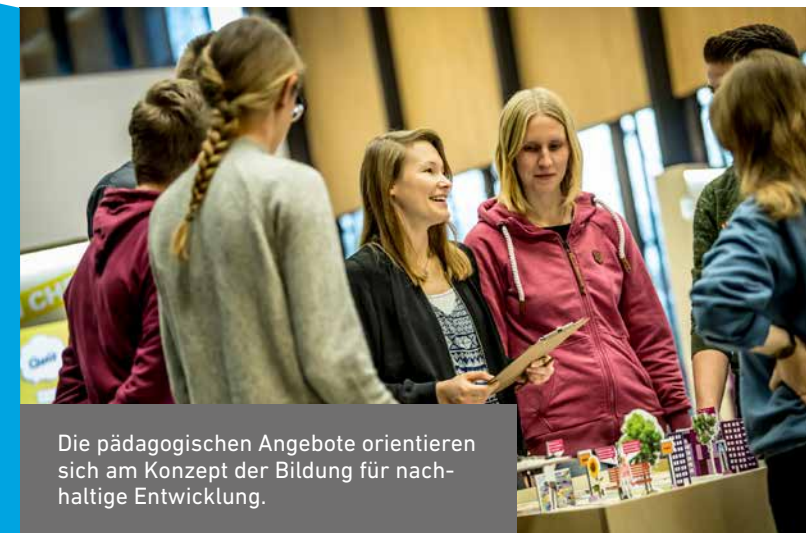
Die pädagogischen Angebote orientieren sich am Konzept der Bildung für nachhaltige Entwicklung.

Begleitend zu der Ausstellung finden einmal im Monat Vorträge statt. Diese beinhalten auch eine öffentliche Führung.