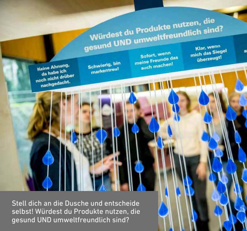
Stell dich an die Dusche und entscheide selbst! Würdest du Produkte nutzen, die gesund UND umweltfreundlich sind?