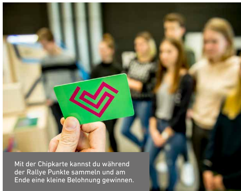
Mit der Chipkarte kannst du während der Rallye Punkte sammeln und am Ende eine kleine Belohnung gewinnen.

Sammele an jeder Station fleißig Punkte mit deiner Chipkarte und schau genau hin, ob sich irgendwo noch Punkte versteckt haben. Am Ende verrät dir die Chipkarte bei der Auswertung, wie es um dein Wissen steht. Du wirst schnell merken, dass es ganz leicht ist, deinen Alltag mit weniger Risiken und Nebenwirkungen für uns und unsere Umwelt zu gestalten.