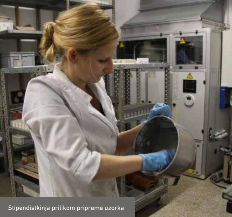
Stipendistkinja prilikom pripreme uzorka