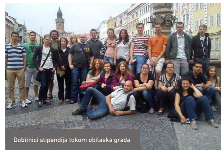
Dobitnici stipendija tokom obilaska grada