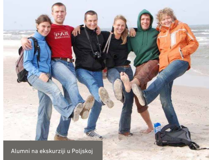
Alumni na ekskurziji u Poljskoj

Svake godine DBU dodjeljuje do 60 stipendija za dalje usavršavanje u svima oblastima okoliša i ekologije u duhu podrške mladim talentima. Stipendije se dodjeljuju kvalifikovanim Master diplomcima iz svih disciplina iz zemalja Centralne i Istočne Evrope. One omogućavaju 6-12-mjesečni boravak u okviru njemačkih institucija: univerziteta, istraživačkih instituta, kompanija, agencija za zaštitu okoliša i ekologiju, nevladinih organizacija, udruženja, itd. U toku trajanja fellowship-a diplomci rade na pronalaženju rešenja za aktuelne okolišne probleme. Nakon boravka u Njemačkoj Alumni su bolje pripremljeni za rješavanje sličnih problema u svojoj zemlji, na ovaj način osiguravajući transfer znanja u matičnu zemlju. Putem međunarodne saradnje se uklanjaju postojeće barijere i uspostavljaju novi kontakti, gradeći snažnu mrežu posvećenih stručnjaka za zaštitu okoliša.